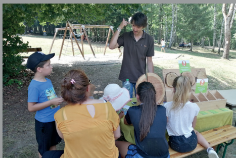
Découverte de la filière