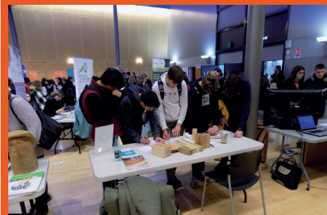
Découverte des métiers