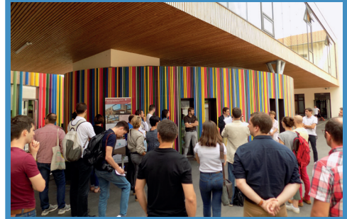
Promotion du bois