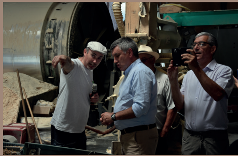
Représentation auprès des collectivités partenaires