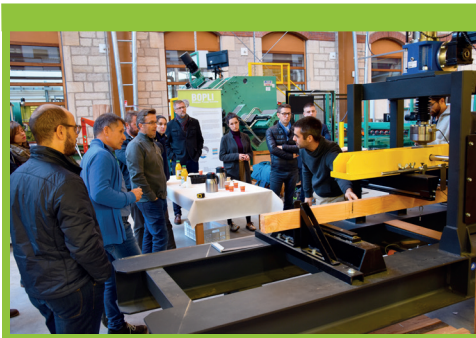
Accompagnement des entreprises