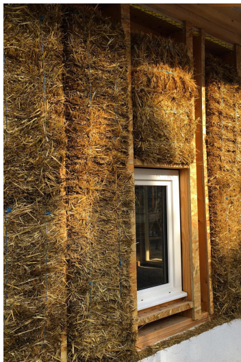
Alsh de Vinsobres / ATELIER D'ARCHITECTURE UGO NOCERA et ATELIER NAO © Jacques Anglade