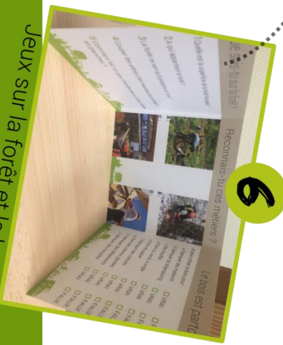
Jeux sur la forêt et le bois