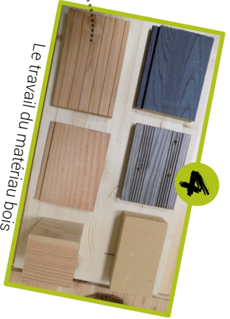
Le travail du matériau bois