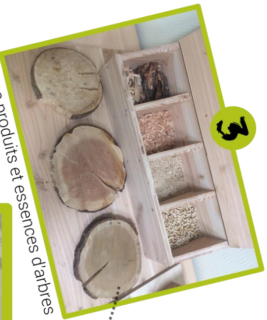
Sous produits et essences d'arbres