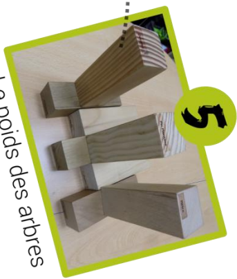
Le poids des arbres