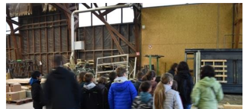
Visite d'une scierie/fabrication de touret (École de Belmont de la Loire)