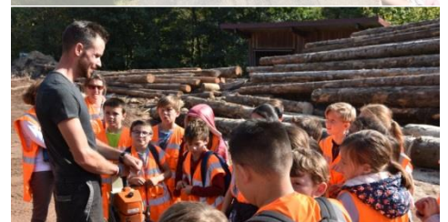
Visite d'une scierie (École de Marilly d'Azergues)