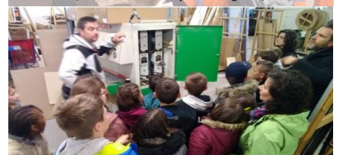
Visite d'une menuiserie (École de Belmont de la Loire)