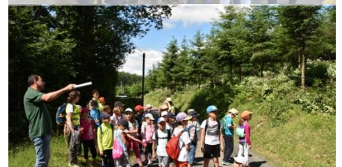
Visite d'un chantier de sylviculture (École d'Éveux)