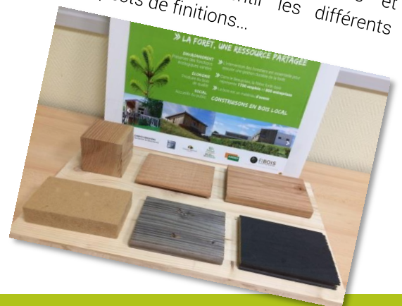
Planche avec différents produits issus de la transformation du bois. Elle permet de montrer des échantillons de produits que l'on peut obtenir en travaillant le bois et notamment ressentir les différents aspects de finitions...