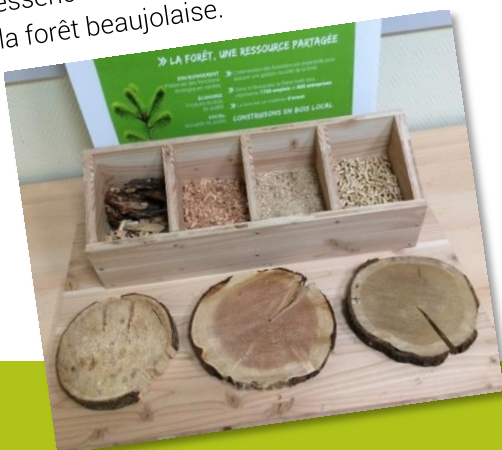
Planche illustrant différentes essences que l'on peut trouver dans la forêt beaujolaise.