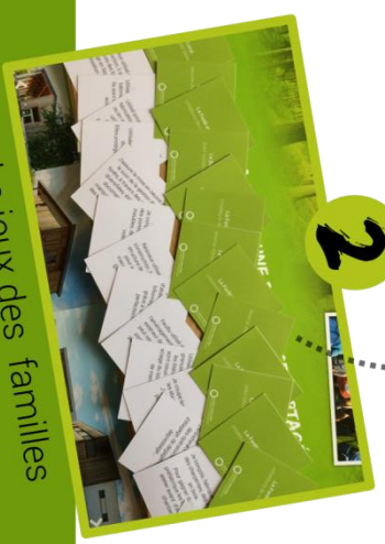
Le jeux des familles