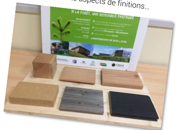
Planche avec différents produits issus de la transformation du bois. Elle permet de montrer des échantillons de produits que l'on peut obtenir en travaillant le bois et notamment ressentir les différents aspects de finitions...