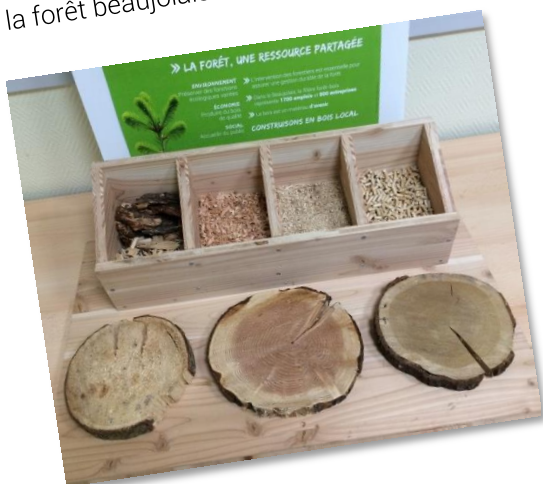
Planche illustrant différentes essences que l'on peut trouver dans la forêt beaujolaise.